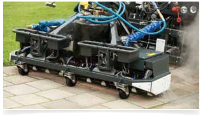
Gezielte Bekämpfung durch Sensordetektion

Die Baureihe WAVE Professional Series umfasst 3 Aufbaumaschinen und 3 Handmaschinen. Bei allen Maschinen wird das Unkraut gezielt bekämpft, mit einer praktischen Handlanze, über ein Dosiersystem mit Handbedienung oder über Sensortechnik. In Kombination mit einem Pufferspeicher spart unsere patentierte Technologie 70-90 % Wasser und Energie. Alle Maschinen können mit Oberflächenwasser befüllt werden. Dank der sicheren Funktionsweise und des niedrigen Drucks sind die Maschinen einfach, praktisch und auf allen befestigten Flächen einsetzbar.