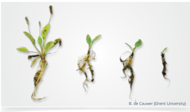
Das Unkraut wird mit jeder Behandlung weiter geschwächt.

Wasser ist einer der besten Energieträger in der Natur, und die WAVE-Methode nutzt diese Eigenschaft so effizient wie möglich. Bei der WAVE-Methode wird Unkraut mit 100 % Heißwasser mit einer Temperatur von 98 °C bekämpft. Die freigesetzte Energie zerstört die Zellstruktur der Pflanze. Oberirdische Pflanzenteile sterben ab und mit jeder Behandlung werden auch die Unkrautwurzeln weiter geschwächt. Das Ergebnis ist ein sauberes, einheitliches Straßenbild während des ganzen Jahres. Die WAVE-Methode drängt Unkraut nachhaltig zurück.